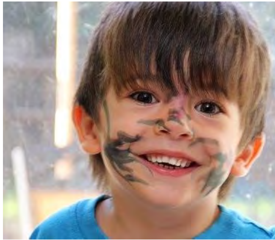
4 η εικόνα