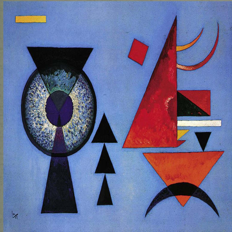
Μαλακό Σκληρό (1927)